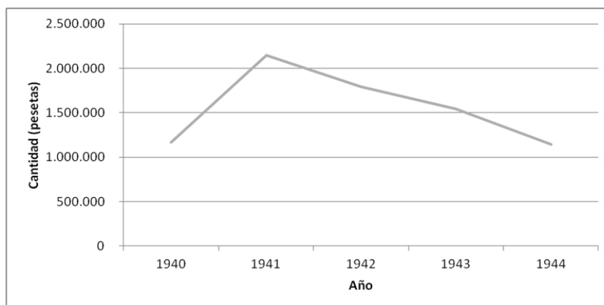
Figura 1. Importe destinado a cantinas y comedores escolares